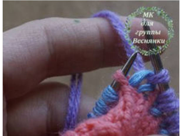
фото процесса прибавки из петли предыдущего ряда демонстрируется на спицах №3 и толстой пряже трех контрастных цветов для наглядности голубая нить - ряд который мы провязываем, сиреневая нить ряд с прибавками который мы провязали.

Левой спицей подхватываем петлю и провязываем сиреневой нитью