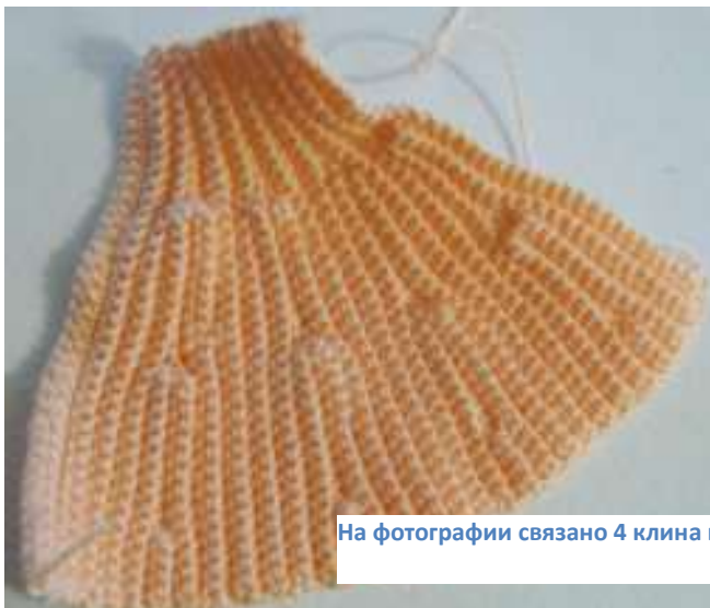
На фотографии связано 4 клина юбки.

4-17 ряд – 1 клин юбки. Юбочка из 14 клиньев.