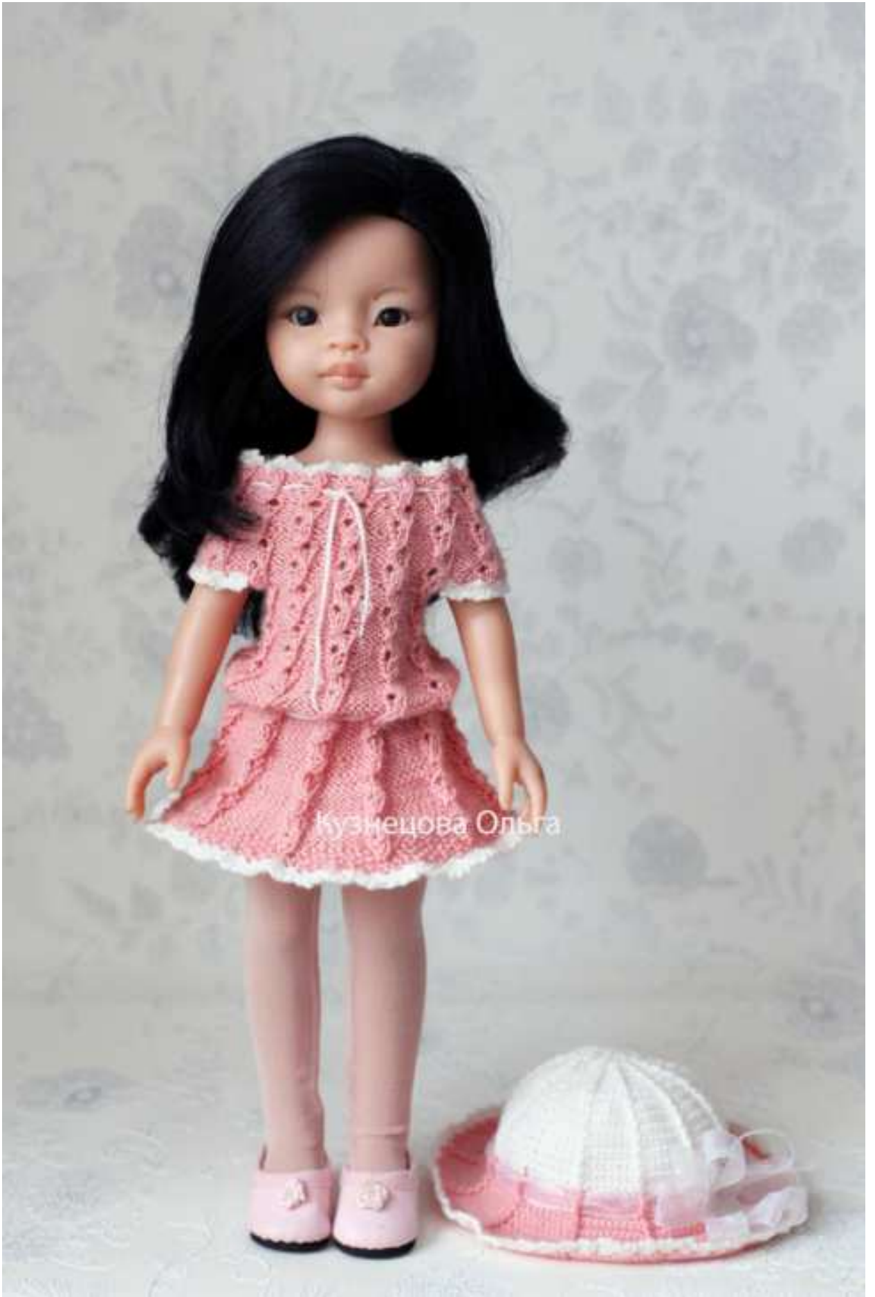
Вариант – Комбинезон