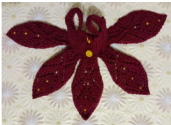
Схема вязания лепестков.

В результате у нас получается вот такая деталь. Я сразу пришила пуговички, чтоб потом было удобнее мерить.