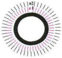
Схема «диска» к модели 11