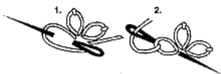
LAZY DAISY STITCH

Для Цветов Верхней части фартука (см. иллюстрацию) с помощью шва Ленивая маргаритка нитью розового цвета в два сложения вышить 5 цветков, распределив их равномерно в 8 ряду