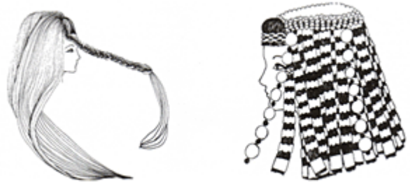
Сборка головного убора по схеме.

Продолжать заплетать косички по всей голове куклы, сделав всего 30-35 косичек. На каждую косичку нацепить по 8 маленьких филигранных цилиндров.